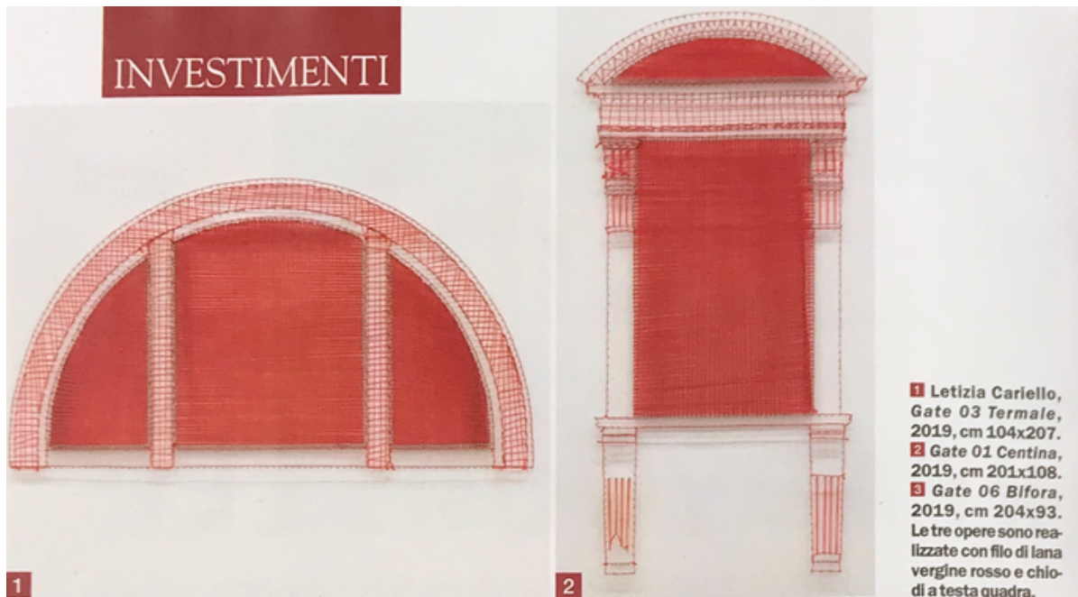
1 Letizia Cariello, Gate 03 Termale , 2019, cm 104x207. 2 Gate 01 Centina , 2019, cm 201x108. 3 Gate 06 Bifora , 2019, cm 204x93. Le tre opere sono realizzate con filo di lana vergine rosso e chiodi a testa quadra.