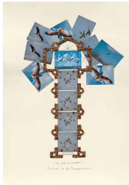
Marinus Boezem, A Volo d'Uccello , Basilica di San Francesco d'Assisi, 2010, stampa Hahnemuehle Fine Art, 109x79x4 cm. Edizione 52/80.

La Galleria Fumagalli ha riproposto il progetto A Volo d'Uccello nel 2019 in occasione della mostra di Marinus Boezem Bird's-eye View , a cura di Lorenzo Bruni. Nello spazio principale della galleria è stata realizzata con mangime per volatili la pianta della Basilica di San Francesco d'Assisi che, anche grazie ai rami d'albero posti alle pareti, ha trasformato il contenitore architettonico in un luogo di suggestioni in cui le categorie di esterno e interno, cultura e natura, storia e memoria richiedono d'essere riformulate.