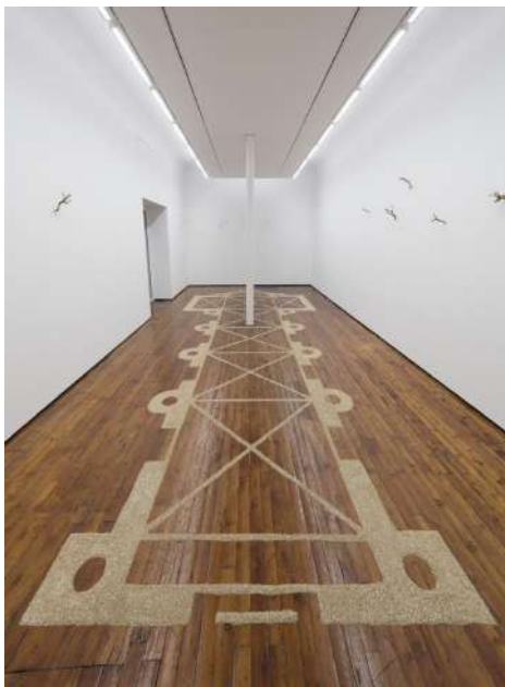
Veduta della mostra Marinus Boezem, Bird's-eye View , Galleria Fumagalli, Milano, 2019.

Il video A Volo d'Uccello è visibile esclusivamente a questo LINK digitando la password: Volo